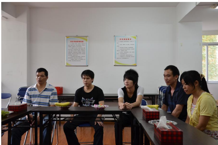
2011 年 7 月 26 日，参加座谈会的福建培训班的 5 位盲人学员

5 位在福州就业的学员参加了座谈会，之后巡视组到他们的工作单位进行了实地走访，通过与他们交流，能感受到他们的感激和愉悦之情。