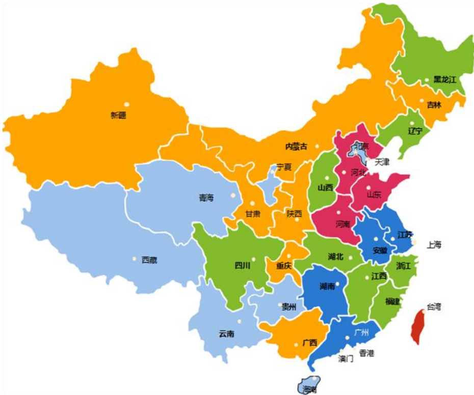
图4 2010年--2014年受助白血病患者地域分布

通过本次回访工作，我们总结了“小天使基金”在“十二五”期间（2010年--2014年）全国31个省、市受助白血病患儿的数量，从图4中可以清晰地分析项目在全国分布势态。