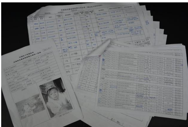
受助患儿资料和原始回访记录