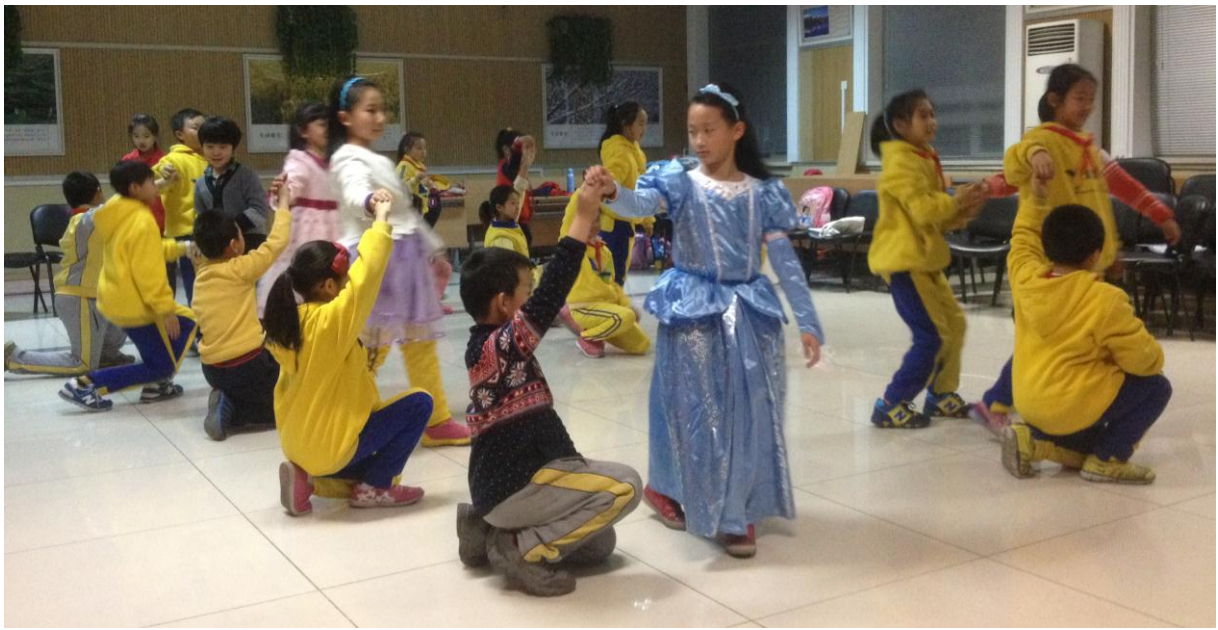
图 16 革新里小学的孩子们在排练话剧《灰姑娘》