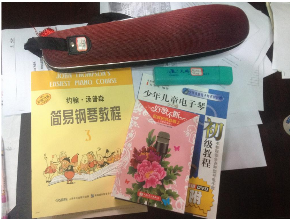
图3 蜀辉学校用项目资金购置的乐器和教材

每天中午利用课余时间开展艺术教育活动，教师和学生定期提交参加活动心得，师生之间的沟通也得以增强。