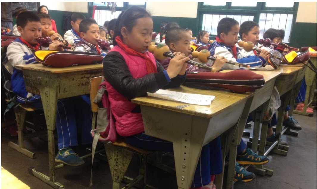
图7 蜀辉学校的葫芦丝社团（葫芦丝为项目资助）

中午各个社团进行艺术课程的时候，校园里歌声、演奏声不断。项目的开展使得该校屡次在各种艺术比赛中获奖，不仅提升了学校的艺术氛围和美誉度，也使得周围居民刮目相看。