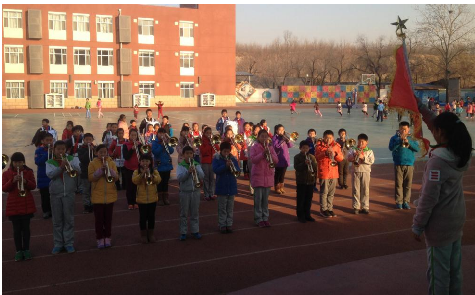
图 13 石油二小的鼓号队