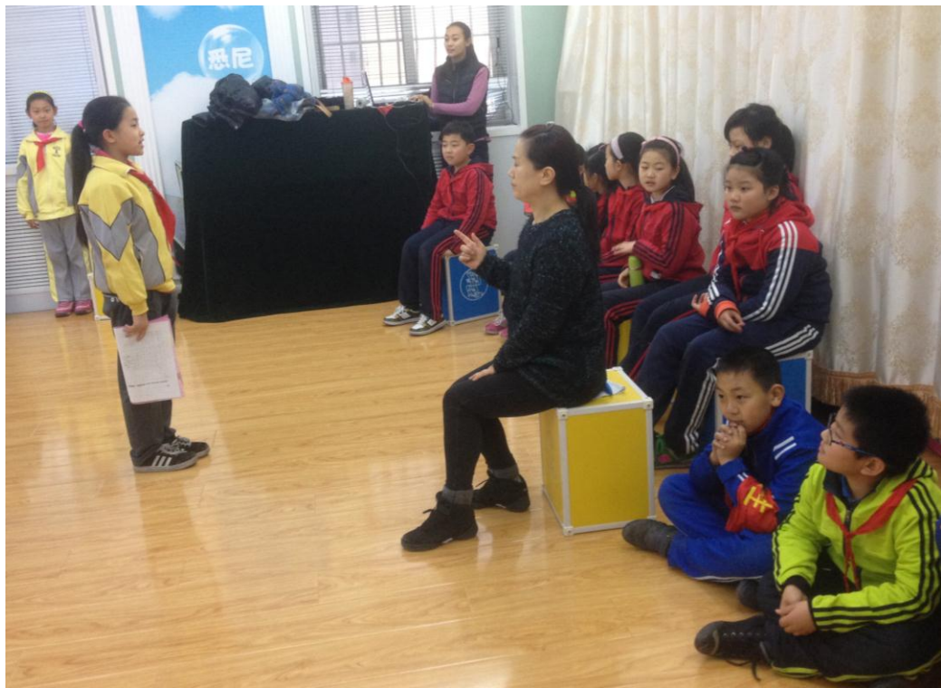
图 17 来自中国儿童艺术剧院的外聘老师（中）在辅导表演