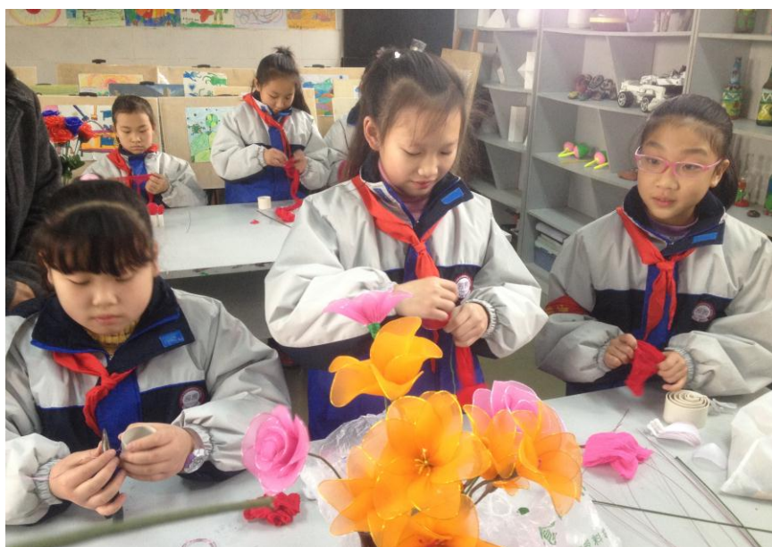
图 10 西蜀学校的学生们在学习制作丝网花

据老师介绍，该校有名学生的父亲罹病去世，家庭骤然困顿，原来一直在校外自费参加的绘画辅导班无法继续，幸亏有了“阳光艺术教室”的免费绘画兴趣班，给了孩子及其母亲极大的安慰。