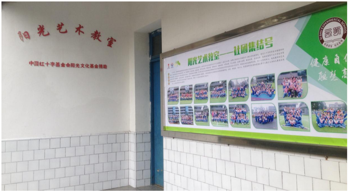
图 20 成都西蜀学校的阳光艺术教室