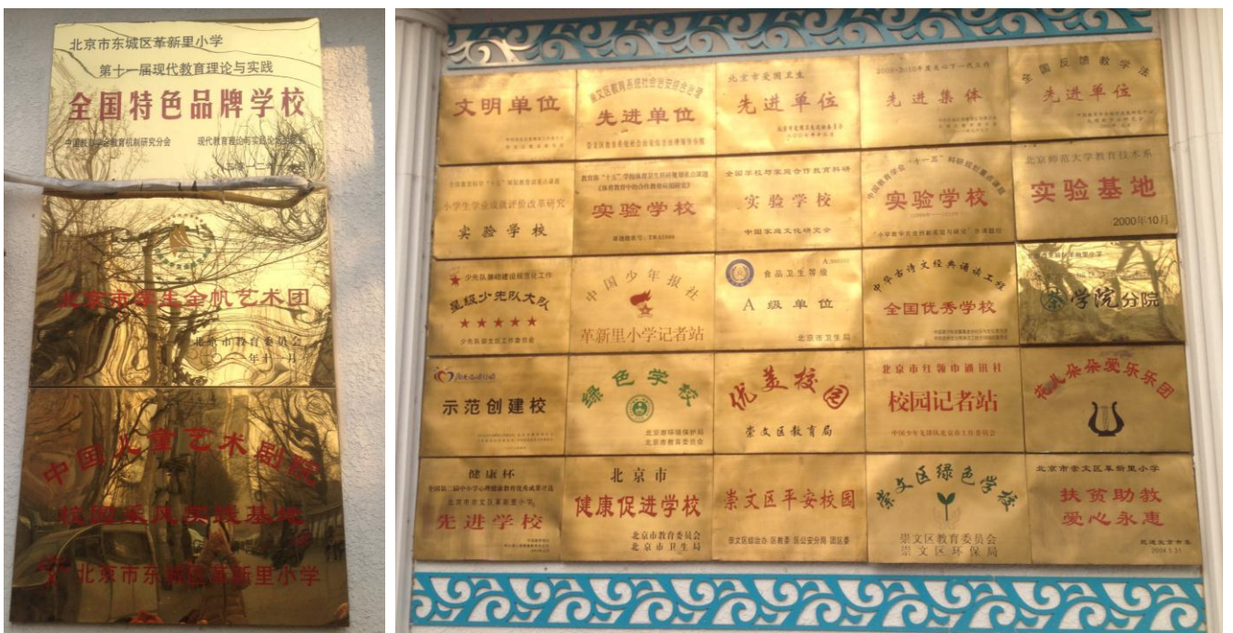
图 15 革新里小学获得各种的奖项

2011 年，革新里小学话剧团获得了北京“金帆话剧团”的桂冠，话剧为该校的校本课，具有鲜明特色。“阳光艺术教室”项目的引入更加充实了本校的“阳光”、“艺术”的办学理念，而话剧就是本校“阳光艺术教室”项目的主要内容。