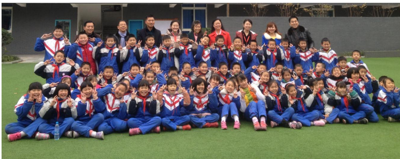
图1 回访组与成都西蜀实验学校的学生们在一起

12月18日，对北京东城区革新里小学进行实地走访，并与阳光文化基金工作人员交换项目意见。