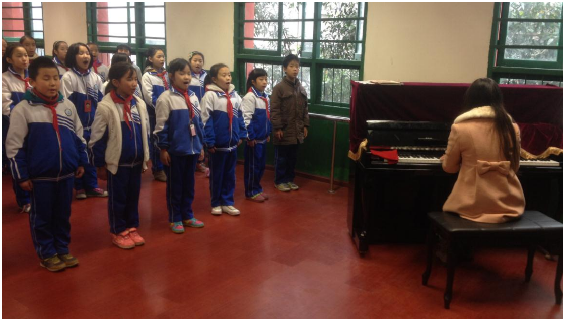
图6 蜀辉学校的合唱团（伴奏钢琴为项目资助）