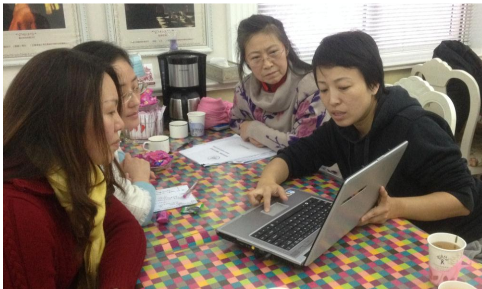
图2 成都汇智北京项目官员向回访组展示项目电子档案