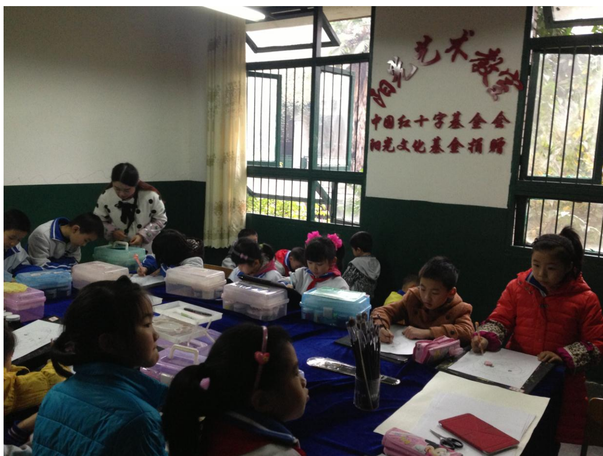
图 19 成都蜀辉学校的阳光艺术教室及绘画班

回访中，各学校的“阳光艺术教室”及项目宣传册均有体现项目标识和捐方，各项目负责人都能说清楚项目资金来源及主要用途，尤其是成都的两所学校。总体来看，对于项目宣传和理解比较到位。