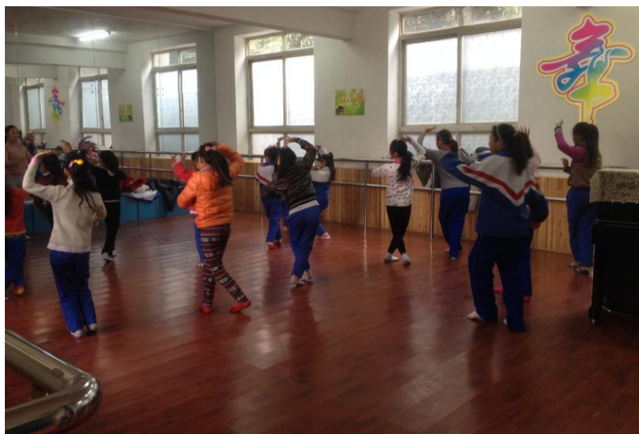
图 11 舞蹈队在阳光艺术教室里练习舞蹈