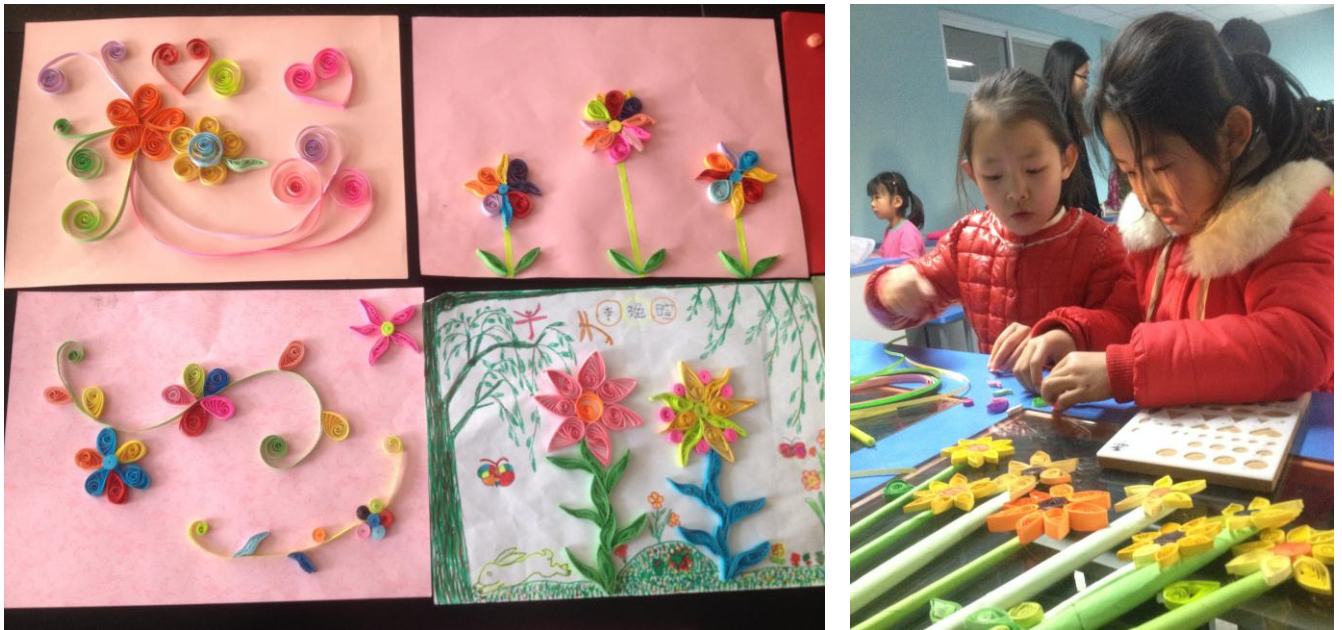
图 12 石油二小衍纸班学生们的作品

当我们与参加艺术团队的学生们交流时，感受到孩子们对参加艺术课程的热情和良好的精神面貌，其中鼓号队的小江和小伟兄弟两个令我们印象深刻。