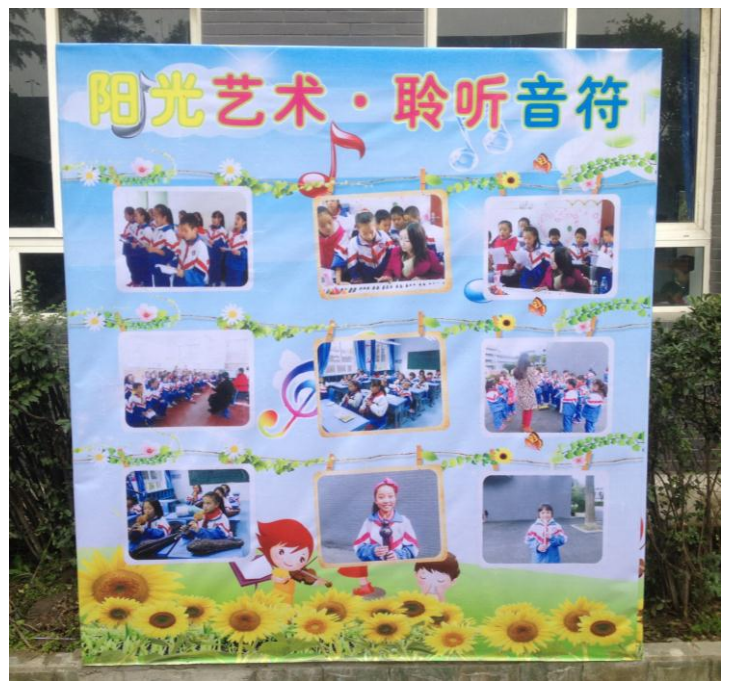
图 21 成都西蜀学校制作的项目特刊和项目展示牌